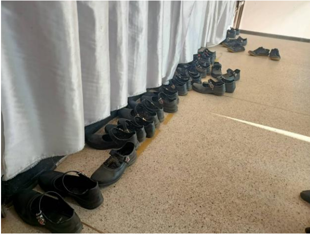
ภาพถ่ายเปรียบเทียบก่อนและหลังดำเนินโครงการ